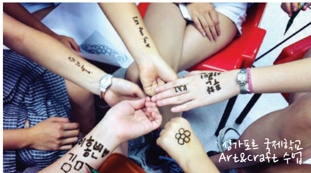
싱가포르 국제학교 Art&craft 수업