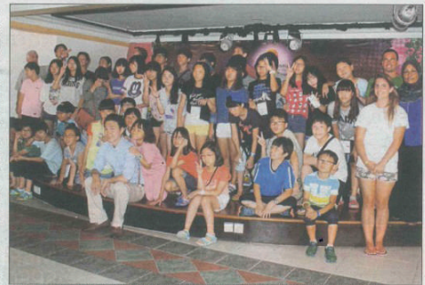
Korean students and teachers had a smashing time at the Desaru Beach Resort.