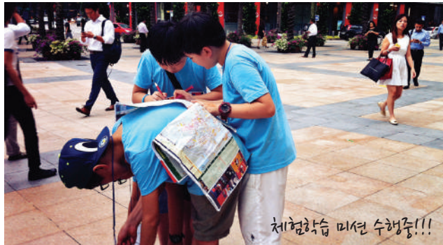
체험학습 미션 수행중!!!