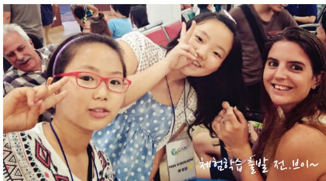
체험학습 출발 전.보이~

[답사지역] 유니버셜 스튜디오, 동물원 (또는 리버사파리), 사이언스센터, 반딧불이 투어 등