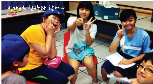
싱가포르 친구들과 함께~