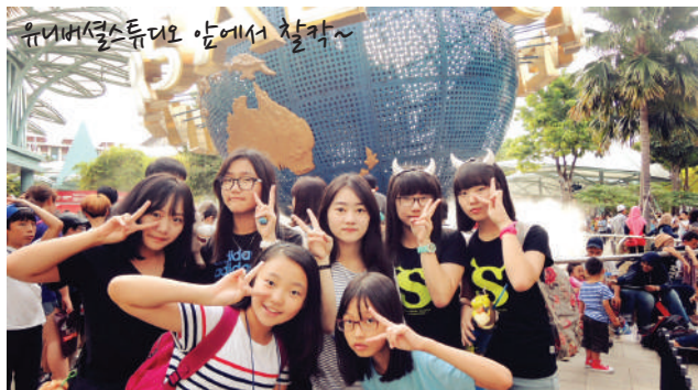
유니버셜스튜디오 앞에서 촬영~