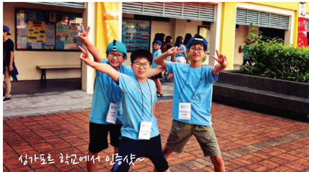
싱가포르 학교에서 인증샷~