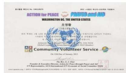
<UN 국제 인증 봉사활동 확인서>