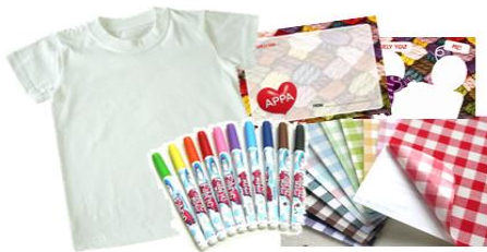
<T+T 프로젝트 꾸러미>